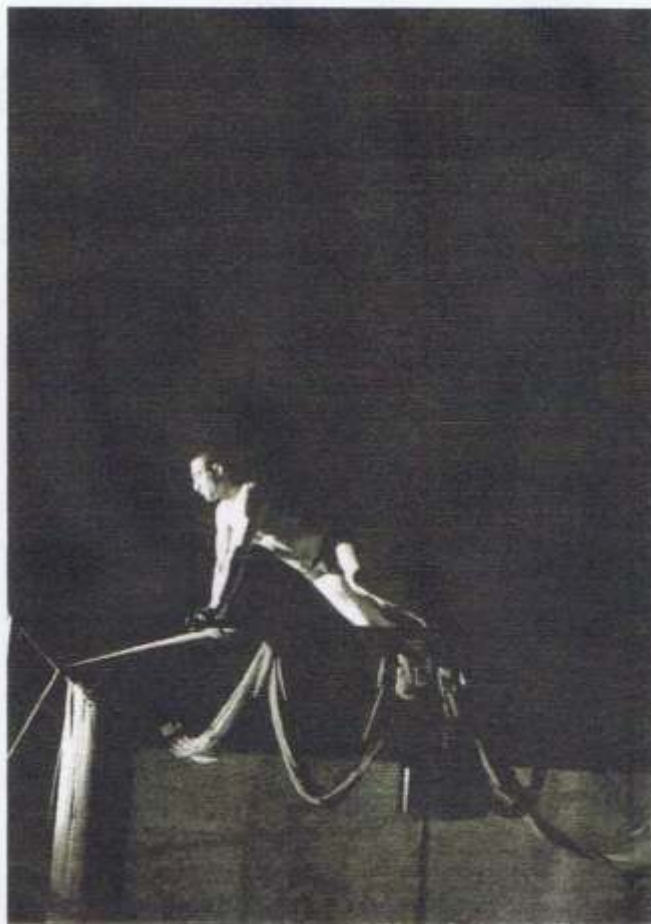
Estreno de la obra, ayer, en el Hospital Real.